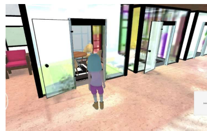
<소셜 콘텐츠 인터페이스 예시>