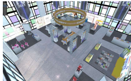
<커머스 콘텐츠 인터페이스 예시>