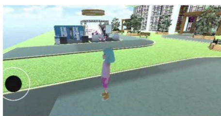
<전시 콘텐츠 인터페이스 예시>